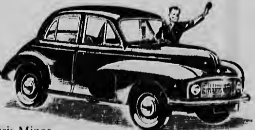
Morris Minor 2-deurs coupé

De reden WAAROM! 40 Jaar lang belastte de Engelse fiscus auto's naar paardekraacht. De fabrikanten waren derhalve genoodzaakt, veel te bieden in klein bestek. Seldert lang heeft Morris de leiding bij de fabricage van prima wagens met bescheiden aantal P.K. Het bewijs is de nieuwe Morris Minor! Een verbeterde editie van een serie wagens die over de gehele wereld hun betrouwbaarheid hebben bewezen. Met alle goede eigenschappen van grotere wagens. En HOE! • Binnen wielbasis 4 zitplaatsen • 0,3 kub. M. bagageruimte • Motor-capaciteit 27 P.K. • Onafhankelijke torsie-voorwielvering voor soepel rijden • Chassis en carrosserie gebouwd als één geheel voor extra sterkte • Lockheed hydraulische remmen • Speciale roest-afweer beschermt de fijne afwerking • Gemakkelijk in het verkeer, te parkeren en in de garage te zetten